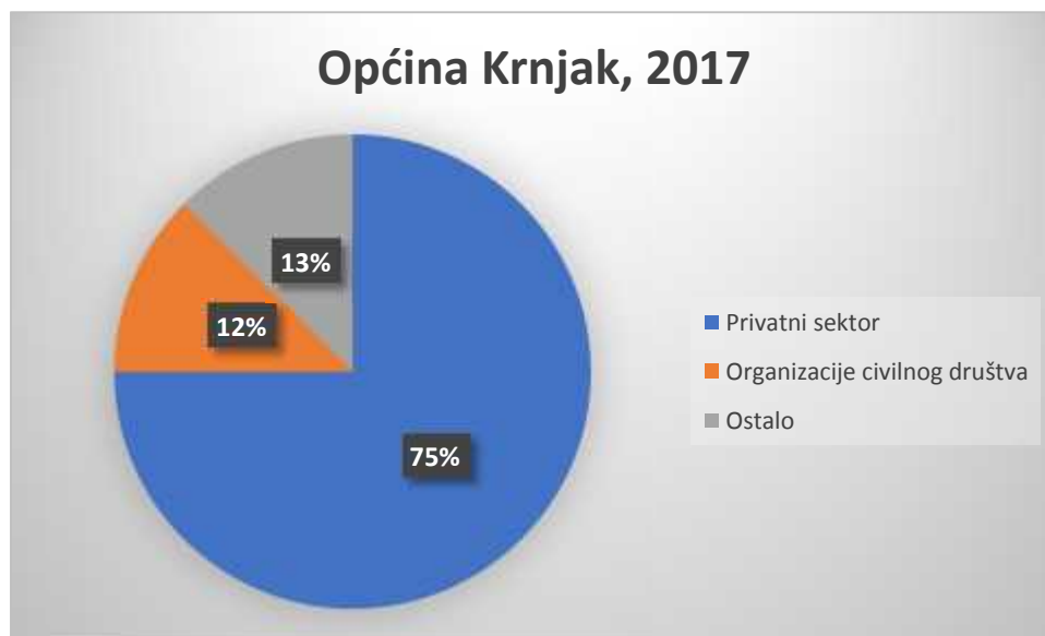
Slika 1. Struktura zaposlenih u Općini Krnjak, 2017.

Vezano uz korištenje prava propisanih člankom 22. Ustavnog zakona o pravima nacionalnih manjina, tu mogućnost je iskoristilo 11 osoba, od kojih je 5 primljeno na natječaj. Ovako velik broj zaposlenih osobe u JLS može se zahvaliti Programu javnih radova, međutim ovo je samo privremeni pokazatelj, pošto je zapošljavanje u okviru Programa javnih radova ograničeno na rok od 6 mjeseci. Zanimljivo je da svih 8 ispitanika koji nisu primljeni kao razlog navode nacionalnu pripadnost. Analizirajući prikupljene podatke možemo zaključiti da je svaki četvrti ispitanik iskoristio pravo na pozitivnu diskriminaciju pri zapošljavanju, odnosno iskoristio mogućnost pozivanja na članak 22. Ustavnog zakona o pravima nacionalnih manjina. Prema ovome možemo zaključiti da se osobe srpske nacionalnosti ne libe istaknuti svoju nacionalnost kada je u pitanju mogućnost zaposlenja.