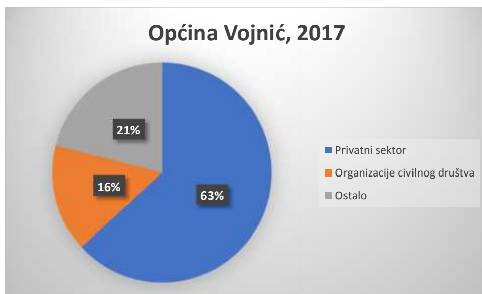
Slika 1. Struktura zaposlenih u Općini Vojnić, 2017.

Prema tablici je vidljivo da je skoro polovica ispitanih pripadnika srpske nacionalne manjine zaposlena. Ovaj podatak je više nego pozitivan kada u obzir uzme činjenica da je Vojnić područje od posebne državne skrbi gdje je gospodarstvo u kontinuiranom trendu stagnacije. Što se tiče mjesta zaposlenja, više od polovice (12) je zaposleno u privatnom sektoru 3 osobe u nevladinim organizacijama/udrugama. Vezano uz zaposlenja u JLS/TDU/PT, Kada govorimo o informiranosti ispitanika o natječajima raspisanim od strane TDU/PT/JLS, 15 osoba koje su ispunile anketu su imale saznanje o slobodnim radnim mjestima od kojih se 13 javilo na jedan od raspisanih natječaja. Zanimljivo je da se, prema podacima iz ankete, samo jedna osoba javila na dva natječaja, dok su se ostale osobe javile samo na jedan natječaj. Vezano uz korištenje prava propisanih člankom 22. Ustavnog zakona o pravima nacionalnih manjina, tu mogućnost je iskoristilo 11 osoba, od kojih je 5 primljeno na natječaj. Ovako velik broj zaposlenih osoba u JLS može se zahvaliti Programu javnih radova, međutim ovo je samo privremeni pokazatelj, pošto je zapošljavanje u okviru Programa javnih radova ograničeno na rok od 6 mjeseci. Zanimljivo je da svih 8 ispitanika koji nisu primljeni kao razlog navode nacionalnu pripadnost.