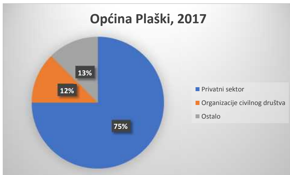
Slika 1. Struktura zaposlenih u Općini Plaški, 2017.

Što se tiče mjesta zaposlenja, više od polovice (6) je zaposleno u privatnom sektoru i 1 osoba u nevladinim organizacijama/udrugama. Vezano uz zaposlenja u JLS/TDU/PT, Kada govorimo o informiranosti ispitanika o natječajima raspisanim od strane TDU/PT/JLS, 13 osoba koje su ispunile anketu su imale saznanje o slobodnim radnim mjestima od kojih se 11 javilo na jedan od raspisanih natječaja. Zanimljivo je da se, prema podacima iz ankete, samo jedna osoba javila na dva natječaja, dok su se ostale osobe javile samo na jedan natječaj. Vezano uz korištenje prava propisanih člankom 22. Ustavnog zakona o pravima nacionalnih manjina, tu mogućnost je iskoristilo 11 osoba.