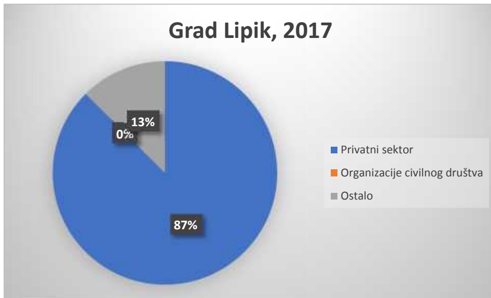
Slika 1. Struktura zaposlenih u gradu Lipiku, 2017.

Pitanje najrelevantnije za naše istraživanje govori o neupućenosti i neinformiranosti naših korisnika o pravima propisanim Ustavnim zakonom o pravima nacionalnim manjina. Naime, niti jedan ispitanik pri apliciranju na natječaj nije se pozvao na članak 22. citiranog Zakona. Posljedično tome niti jedna osoba nije primljena po raspisanim natječajima.